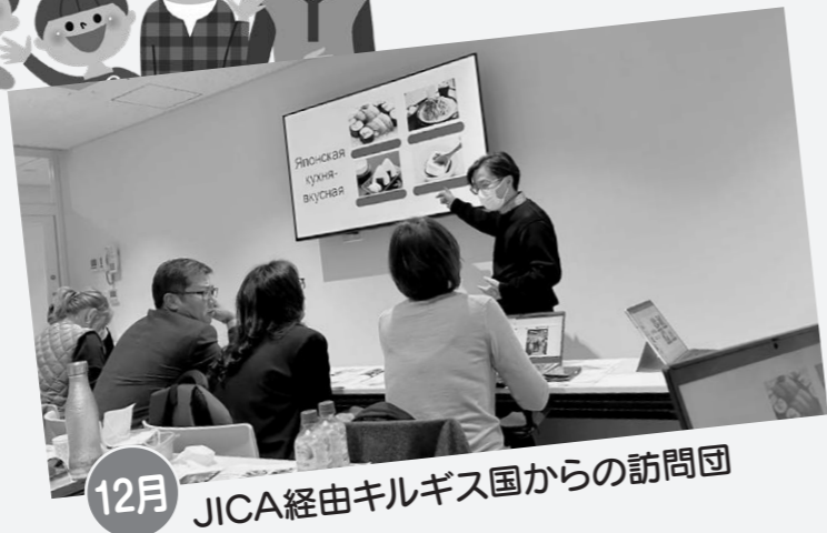
12月 JICA経由キルギス国からの訪問団