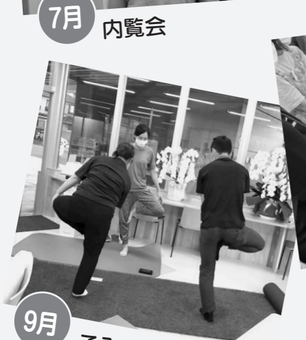
9月 こみてでヨガ教室