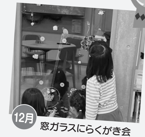
12月 窓ガラスにらくがき会