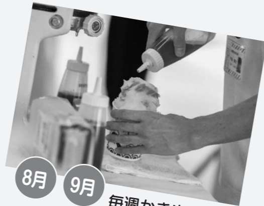
8月 9月 毎週かき氷