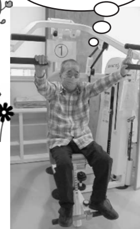
リハビリ頑張るぞ!