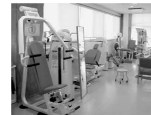
▲新規リハビリマシン