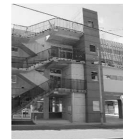
◀3階が「通所リハビリテーションすこやか」です

リニューアルした「すこやか」でリハビリ再開です。 フレッシュな気持ちで頑張りましょう。