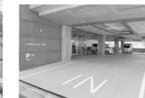
▲送迎車乗降アプローチ