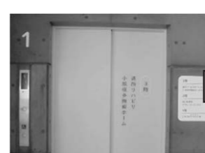
▲3階直通専用エレベーター