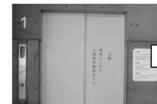
▲3階直通専用エレベーター