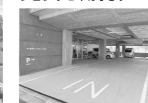
▲送迎車乗降アプローチ