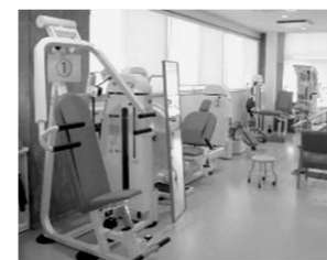
▲新規リハビリマシン