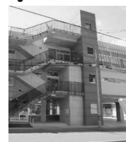
◀3階が「通所リハビリテーションすこやか」です

リニューアルした「すこやか」でリハビリ再開です。 フレッシュな気持ちで頑張りましょう。